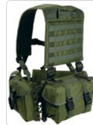
cod. 2ET05 SPALLACCIO TATTICO MULTITASCHE IN CORDURA

Spallaccio tattico multitasche in cordura. Sei tasche P/Caricatori Ar 70/90, M16 con ritenzione ad elastico e chiusura a velcro. Tasche utility. Maniglia trasporto operatore. lacci aggancio al cinturone. Regolazione sulle spalle tramite nastri. Sul retro piattaforma per inserimento accessori sistema Molle o Alice. Tasche interne chiuse a velcro. Spalle comfort imbottite.