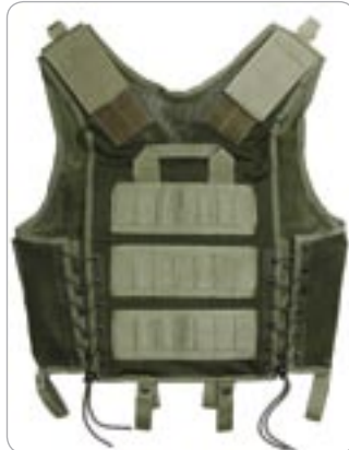
cod. 2ET02 GILET TATTICO IN RETE E CORDURA

Gilet tattico in rete e cordura. Sei tasche P/Caricatori Ar 70/90, M16 con ritenzione ad elastico e chiusura a velcro, tasca utility, tasca con 6 celle cal. 12. Maniglia trasporto operatore. Lacci aggancio al cinturone. Regolazione sui fianchi tramite corda in nylon. Regolazione sulle spalle tramite velcro, sul retro tripla fascia nastro per l'inserimento accessori tramite sistema alice. Doppia tasca interna. Sistema idratazione compatibile (ved. Pag. 52).