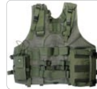
cod. 2ET04 GILET TATTICO IN RETE E CORDURA

Gilet tattico in rete e cordura. Sei tasche P/Caricatori Ar 70/90, M16 con ritenzione ad elastico e chiusura a velcro. Tasca utility. Maniglia trasporto operatore. Lacci aggancio al cinturone. Regolazione sui fianchi tramite corda in nylon. Regolazione sulle spalle tramite velcro. Sul retro tasca porta maschera antigas e tasca porta radio. Doppia tasca interna chiusa a cerniera. Sistema idratazione compatibile (vedi pag. 52). Spalle comfort imbottite, anticivolo per appoggio arma.