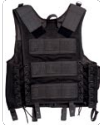
cod. 2ET03 GILET TATTICO IN RETE E CORDURA

Gilet tattico in rete e cordura. Tre tasche P/Caricatori Ar 70/90, M16 con ritenzione ad elastico e chiusura a velcro, tasca utility, tasca con 6 celle cal. 12, tre tasche multi utility per coltello/caricatore/torcia, fondina per L/Auto con Porta caricatore. Maniglia trasporto operatore. Lacci aggancio al cinturone. Doppia tasca interna. Regolazione sui fianchi tramite corda di nylon. Regolazione sulle spalle tramite velcro, sul retro tripla fascia nastro per l'inserimento accessori tramite sistema alice. Possibilità di inserimento scritte sul retro tramite velcro (non incluse). Spalla anticivolo per l'appoggio dell'arma. Sistema idratazione compatibile (ved. Pag. 52).